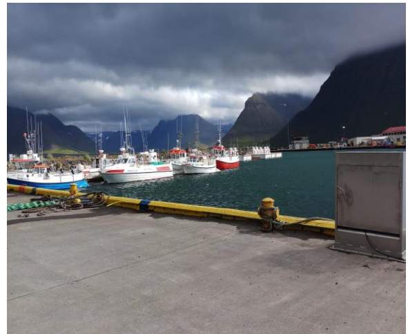
Júlí 2020: Öflug smábátaútgærð aftur komin af stað á Flateyri.