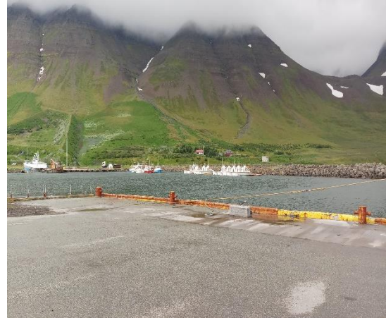
Bátahöfn Flateyri um mitt sumar 2020