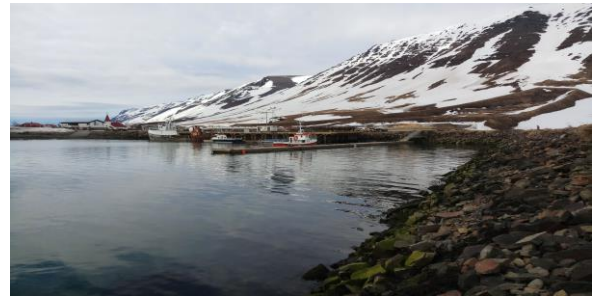
Yfirlitsmynd séð frá grjótvarnargarði að bátahöfn.