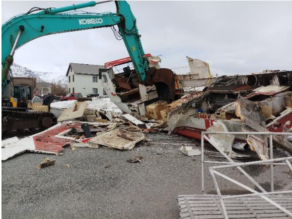
Þarna er verið að brjóta og farga Sjávarperlunni en tryggingarfélag bátsins og eigendur sáu um það verk.