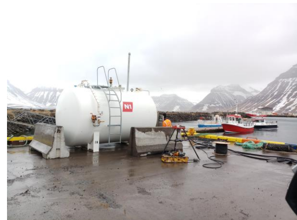
Núverandi staðsetning olíuafgreiðslu N1