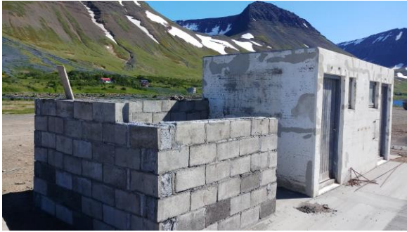
Búið að rétta tengihús og hlaða upp porti fyrir sorp og spilliefnailát.