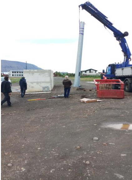
Ljósamastri komið fyrir.