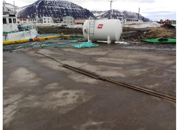
Orri kominn að bryggju og unnið við olíutank.