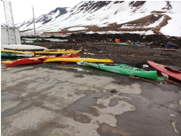
Kajakar mikið skemmdir.