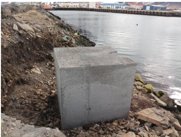
Nýr landstöpull kominn upp fyrir Bobby bryggju